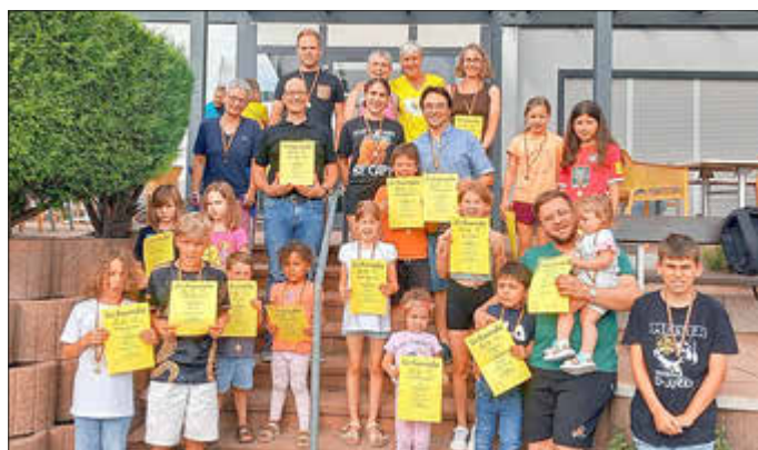
Text und Bild: Jens Hinzen