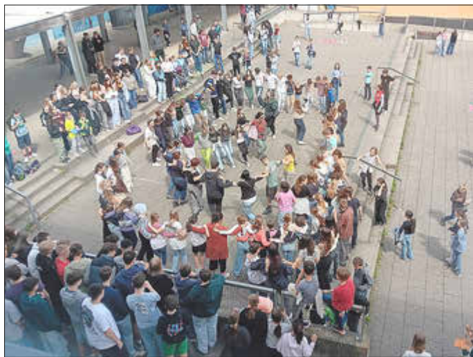
Griechischer Sirtaki in Edenkoben

von jungen Menschen in Europa im besten Sinne in die Tat umgesetzt und mit Leben gefüllt. Wir hatten die Chance das Schulleben, den Alltag, die Kultur & Landschaft in Kreta kennenzulernen, die herzliche Gastfreundschaft unserer griechischen Kolleginnen und ihren Schüler:innen zu erleben und mit dem Gefühl heimzukehren, Freunde gefunden zu haben. So war die Freude groß nur wenige Wochen nach unserer Heimkehr diesmal selbst unseren Gästen unsere Schule und die südpfälzische Heimat näher zu bringen.