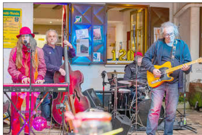
Band miri in The Green sorgte für stimmungsvolle Atmosphäre auf der Totenkopfhütte

In stimmungsvoller Atmosphäre feierte der Verein am vergangenen Samstag, 22. Juni 2024, mit Live-Musik auf der Totenkopfhütte sein langjähriges Bestehen