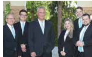
Das Team des Bestattungshauses Drangsal zur Stelle, wenn Sie uns brauchen.

Ihren persönlichen Ratgeber erhalten Sie in unseren Geschäftsräumen in Landau oder Edenkoben.